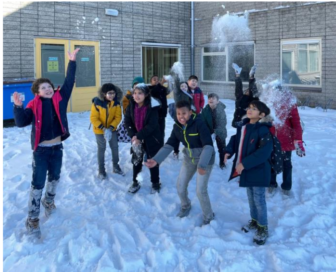
Groep wit na de lockdown veel 'sneeuw'plezier met elkaar.